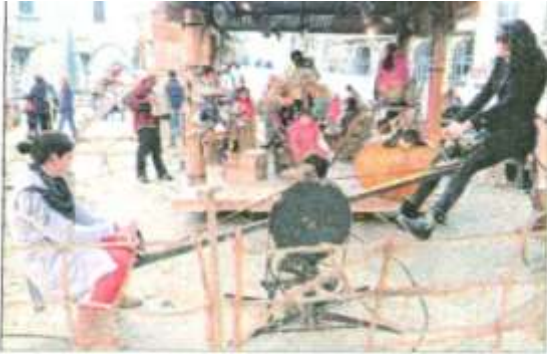
Il fallait que les parents se balancent pour faire tourner le manège.