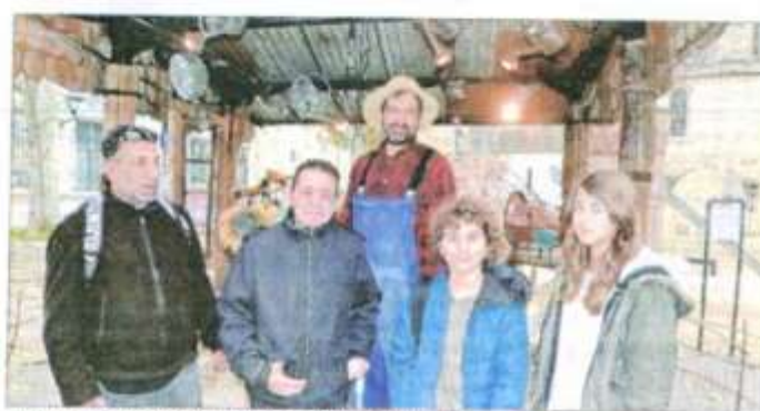
La Cabane de jardin écologique installée sur la place d'Inguibert.