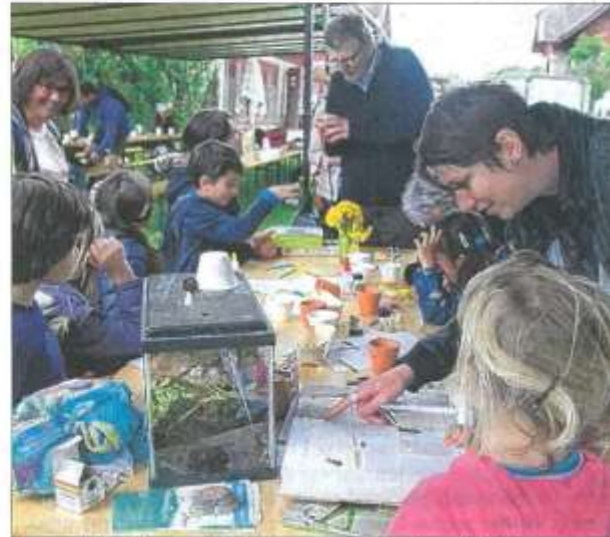
L'association Art Terre de Marin proposera plusieurs ateliers.