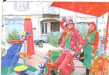
Babs clown et Manouchka vous attendent sur leur Tandem'manège, place du Marché-aux-Oiseaux.