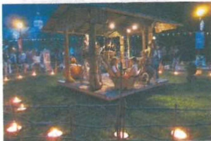
Au Grand Bornand, La Toupine organisera une "Manifrigolote" le 28 août.

Le théâtre de la Toupine jouit d'une grande notoriété dans le milieu du spectacle de rue, notamment grâce à ses trois spectacles, les manèges à propulsion parentale, que tous les Evianais connaissent. Il suffit de se pencher sur le calendrier des spectacles pour se rendre compte que les manèges se déplacent tout le temps et partout. Dans toute la France bien sûr mais aussi en Europe. « Il y a très peu de ma-