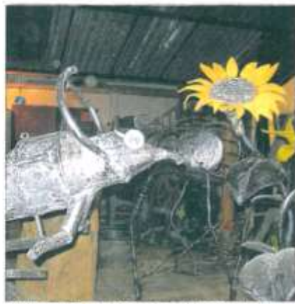
La Cabane de jardin en construction dans les ateliers de la Touperie ! Ici un aperçu avec la chaise tournaicots, mais attention, derrière un koala Schœuffleur vient la renifle... Un Vache de manège et son ours à nez, crâne défilant, avec un vrai regard, des cloches... Et le Bestiaire alpin et ses animaux en bois toute. Le D.L.G.P., S. PÉL et ALBERT.

G.R. La Cabane à jardin, tous les jours, de 15h à 19h, place Jean-Bernez. La Valse des manèges, le 15 décembre, de 15h à 19h, places J.-Bernez et Charles-de-Gaulle. Tous les manèges sont gratuits.