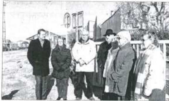
Les visiteurs sur l'emplacement de la future gare, dont le tracé apparaît maintenant très nettement.

Devant des visiteurs accueillis par cette idée de parc, Francis Adolphe a toutefois