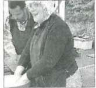
La fabrication du beurre salé.