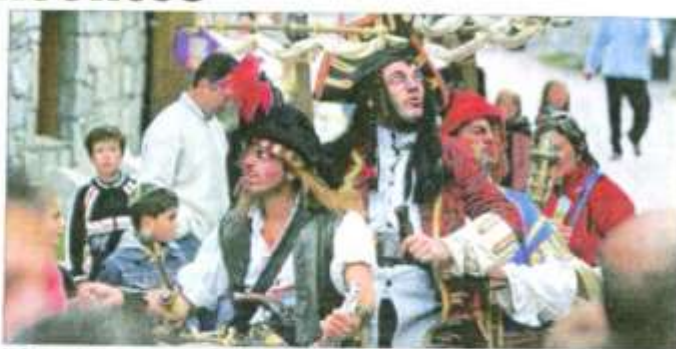
Le bateau pirate, spectacle déambulatoire, partira ce matin et demain à 11 heures de la place de la Mairie.

Les animations et les spectacles de rue des "Noëls insolites de Carpentras" atteignent leur plus grande intensité ce week-end dans les rues du centre-ville avec pas moins de 12 spectacles déambulatoires différents. Ils sont au départ de la patinoire ou de la place de la Mairie. Il faut y ajouter les anima-