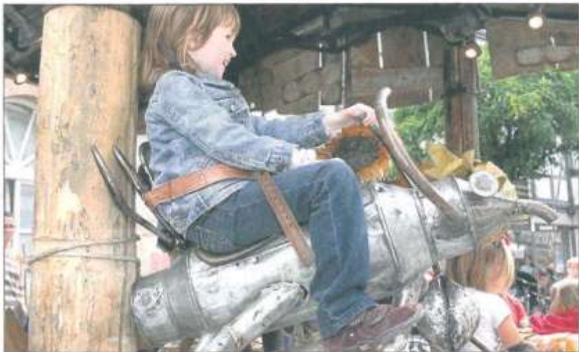
Zu einer Gartenlaube gehören auch Insekten. Von dieser Biene aus lässt es sich schön das Treiben rund ums Karussell beobachten.

Es ist ein Kunstwerk aus Holz, Metall, Leder und Stein. Angetrieben wird es mit Muskelkraft: Die Eltern müssen wippen, damit es rund geht. Sehr zum Vergnügen der Kinder, die ihre Eltern immer wieder antreiben, schneller zu werden.