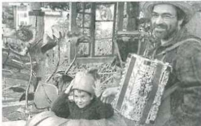
Un manège à énergie parentale...