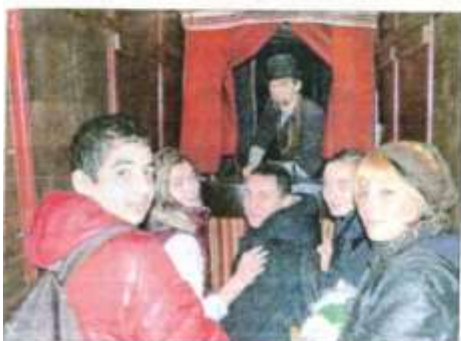
Ratapoll raconte son étonnante histoire d'amour, "Baiser de feu, baiser de fée", sur la place du Général-de-Gaulle.

Tout le programme sur le site de la ville : www.carpentras.fr .