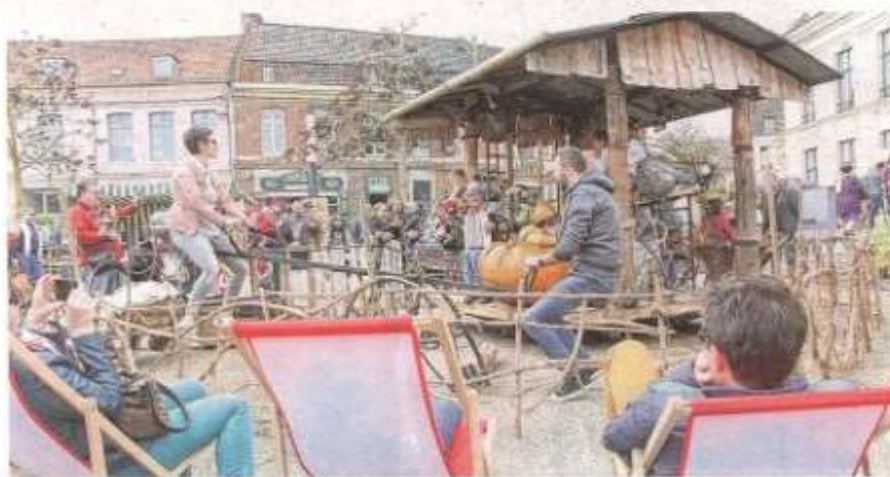
Des transats, du soleil... comme un air d'été sur la place Saint-Amé, ce dimanche.

La journée verte a eu lieu, hier, sur la place Saint-Amé. Encouragé par une météo printanière, le public a répondu présent. La charte de l'arbre a également été signée. Un document censé protéger les arbres de la ville.