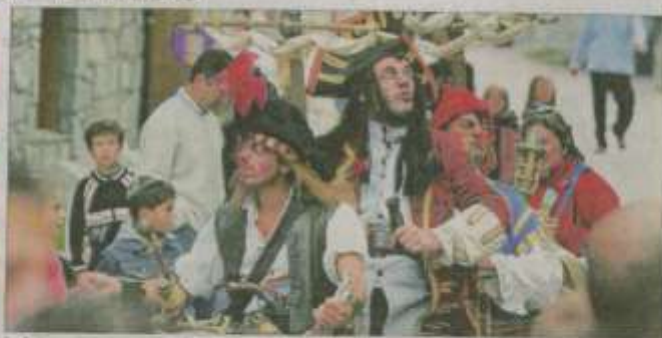
Le Gâteau pirate, spectacle déambulatoire, partira ce matin et demain à 11 heures de la place de la Mairie.

Les animations et les spectacles de rue des "Noëls insolites de Carpentras" atteignent leur plus grande intensité ce week-end dans les rues du centre-ville avec pas moins de 12 spectacles déambulatoires différents. Ils sont au départ de la patinoire ou de la place de la Mairie. Il faut y ajouter les animations "fixes" réparties jus-