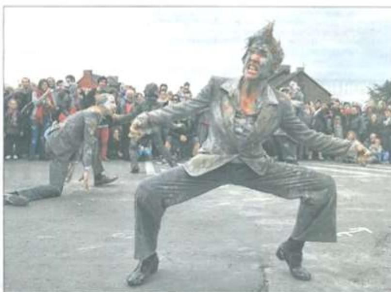
Difficile de résister aux facéties et à l'immense talent des « Monstres d'humanité », de la Cie N°8.