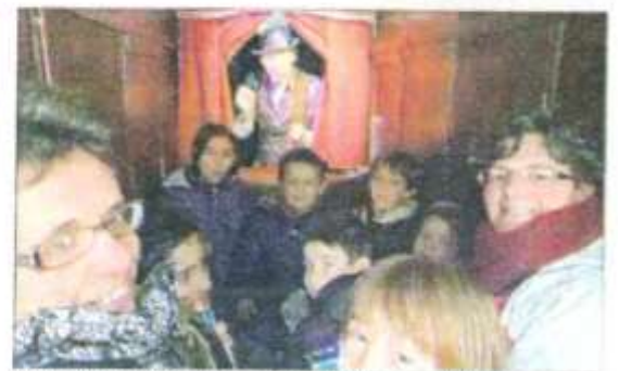
Baiser de Feu, baiser de fée, par la Cie Le fil à couper l'eau chauds.