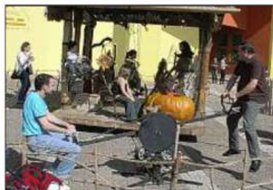
Les parents, en se balançant, faisaient tourner le manège.

mandise croquait une poire malgré l'interdiction de son père... Un spectacle que le nombreux jeune public a bien apprécié. En fin d'après-midi une surprise