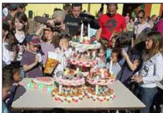
Le gâteau d'anniversaire XXL pour les 5 ans du festival...

Le plus surprenant aura été la cabane à sons du théâtre de la Toupine, un manège mut par les parents à l'aide d'une balançoire. On pouvait aussi déguster d'excellentes crêpes et friandises. Ensuite, au théâtre Jeanné d'Arc se déroulait le