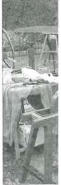
Le rémouleur affûté