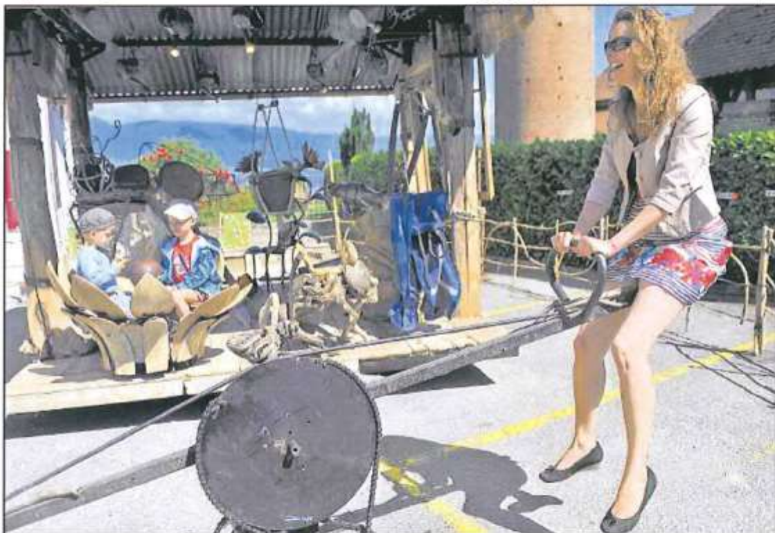
Pour une fois, ce sont les parents qui ont fait tourner leurs enfants en bourrique.

ESTAVAYER-LE-LAC • Le festival du jeu Ludimania'k a pris pour la dixième année ses quartiers au cœur du chef-lieu broyard. Parmi les attractions, un drôle de manège grinçant et poétique, actionné par des adultes.