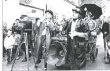
Les "Fotografiers" en action.

costume militaire improvisé avec de simples rouleaux de gros scotch, l'art de faire beaucoup avec peu de chose pour le plus grand plaisir du public qui se portait volontiers