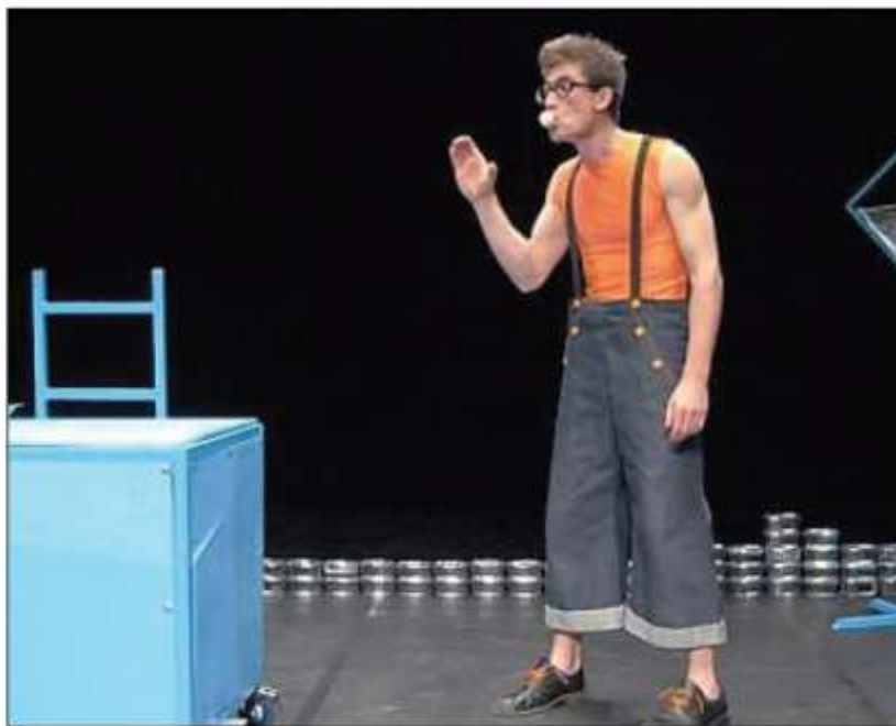
Le spectacle "Les délires aquatico plastiques" sera donné le samedi 24 mars à 18h au théâtre.

Un spectacle présenté par la Compagnie Une autre Carmen, à la passerelle des