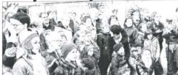
Le public s'est prêté au jeu avec grand plaisir.

Aux défilés des rues, dimanche soir, les "Fotografiers" ont été eux-mêmes beaucoup pris en photo et filmés par le public. Il faut dire que ces photographes mar-