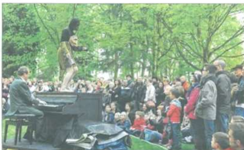
Au parc Jean-Dussenne, l'harmonie entre « La vieille et son pianiste » a séduit bien des spectateurs. Certains sont même venus de Lille, voire d'Alsace, pour ne pas rater ce show musical.