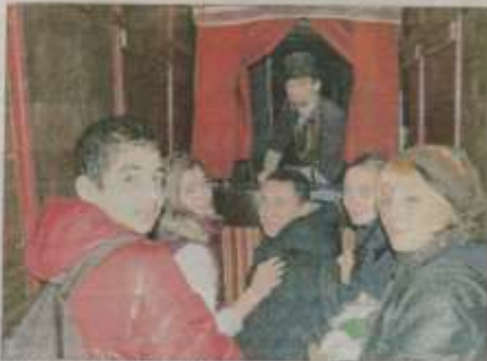
Ratapoti raconte son étonnante histoire d'amour, "Baiser de feu, baiser de fée", sur la place du Général-de-Gaulle.

Tout le programme sur le site de la ville : www.carpentras.fr