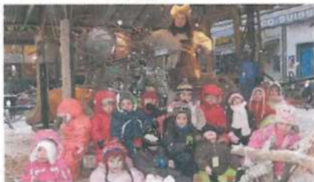
Les plus petits, sous regard attendri d'une Flottine, toujours prête à quelques espiègleries.

A cette occasion, au-delà d'aller rendre visite au gros Drakkar appelé le Drakkamad'ère, que les enfants avaient construit, ainsi que les mobiles réalisés par la maternelle et autres Flottins tous exposés devant le port de commerce, les élèves ont pu découvrir l'exposition sur le bestiaire imaginaire