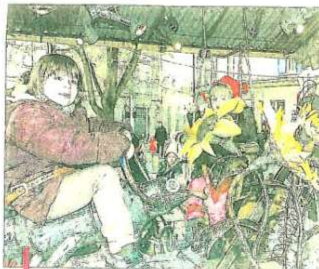
Les enfants tournent pendant que les parents se balancent... Et personne ne s'ennuie.