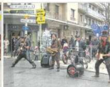
Les Bikers, ce n'est pas Petit Papa Noël !