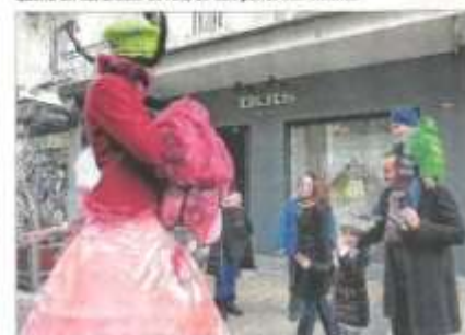
Tu as vu comme elles sont grandes ces dames ?