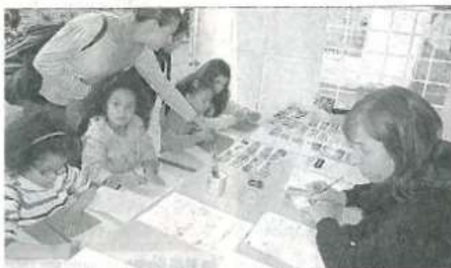
Pleins et déliés écrits à la plume, trempée dans l'encre violette.