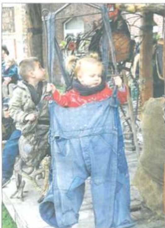
Un peu de douceur et de poésie pour les plus petits, grâce à « La cabane de jardin » installée par la Toupine non loin du château.