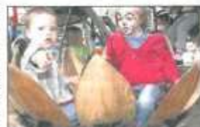
Diese beiden haben es sich in einer großen Blüte bequem gemacht.