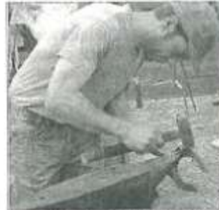
Le maréchal ferrant fabrique des fers pour les chevaux.