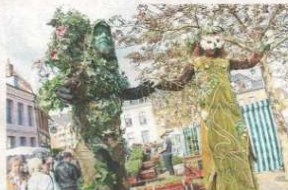
M. Feuilhu, à gauche, n'a pas manqué son effet : du haut de ses échasses, il plane sur la place Saint-Amé.