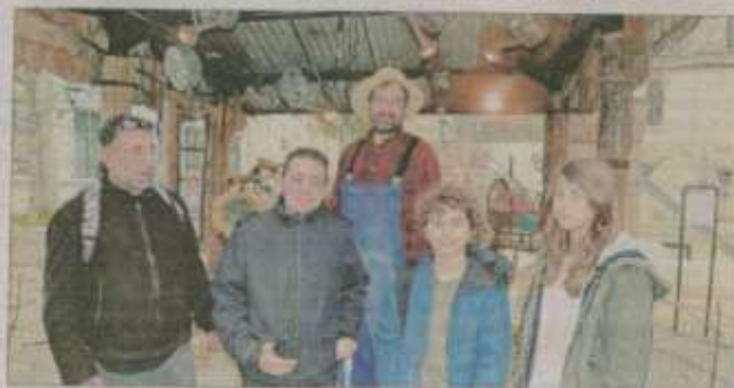
La Cabane de Jardin écologique installée sur la place d'Inguibert.