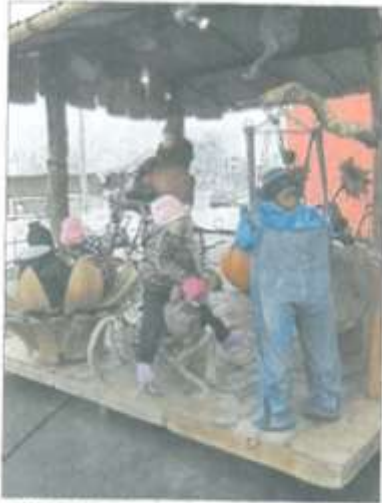
La cabane de jardin un manège pas comme les autres où le plaisir des parents est partagé avec celui des enfants.