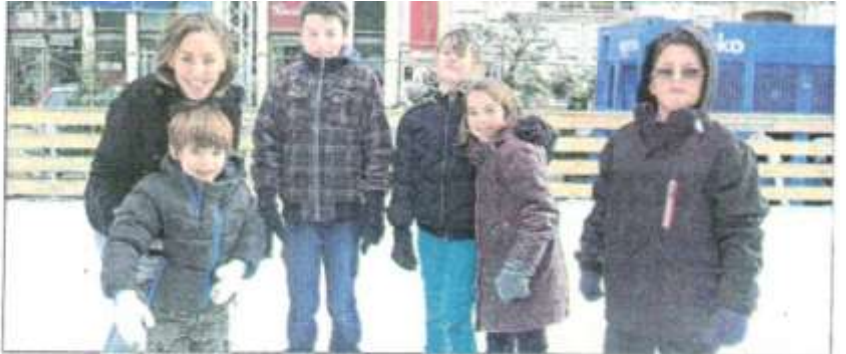
On patinaît en famille sur la place du 25-août-1944.