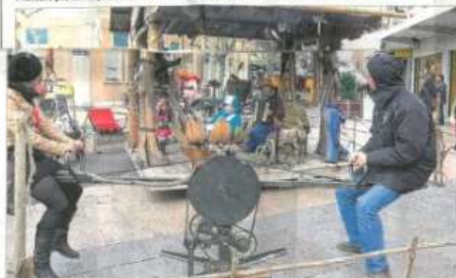
Ce sont les parents qui actionnent le manège, la petite cabane, place de l'Hôtel de Ville.