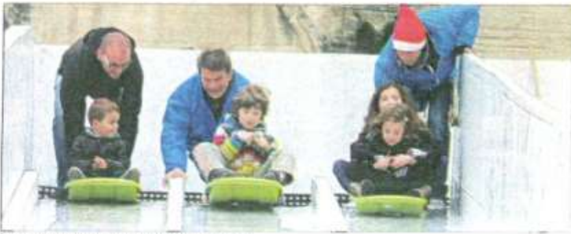
Sur la place d'Inguibert, on faisait de la luge !