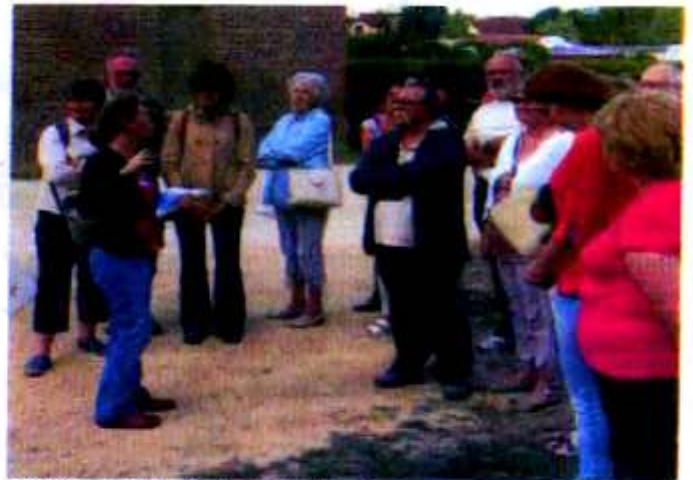
S. H. Visite guidée de la Maladrerie.

Un succès qui sans nul doute, sera poursuivi l'an prochain !