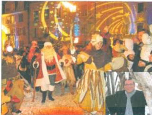
Ils viennent de toutes les Alpes, ces étés, lutins, sirènes, sorcières, farfadets, fées. Ils traversent rivières et torrents pour trouver le repos sur les bords du Léman, et partager leurs légendes avec les enfants. Un monde plein de poésie, pimenté d'un grain de folie, imaginé par Alain Benzoni et son équipe du Théâtre de la Touperie.

Sans oublier l'arrivée et le départ du père Noël. La première année, il avait débarqué par le lac en machine à vapeur et était reparti en six navettes. La seconde, il est arrivé en bar-