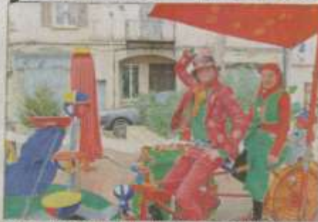
Babs clown et Manouchka vous attendent sur leur Tandem'manège, place du Marché-aux-Oiseaux.