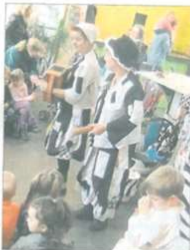
Des dizaines d'enfants sont venus écouter les contes des Petites Poucettes.