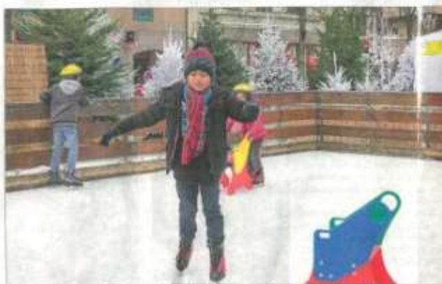
Premiers pas sur la patinoire des enfants, au village d'Annemasse Tourisme devant la mairie.