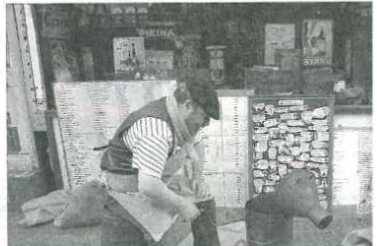
Devant l'épicerie, on grille le café à l'ancienne.