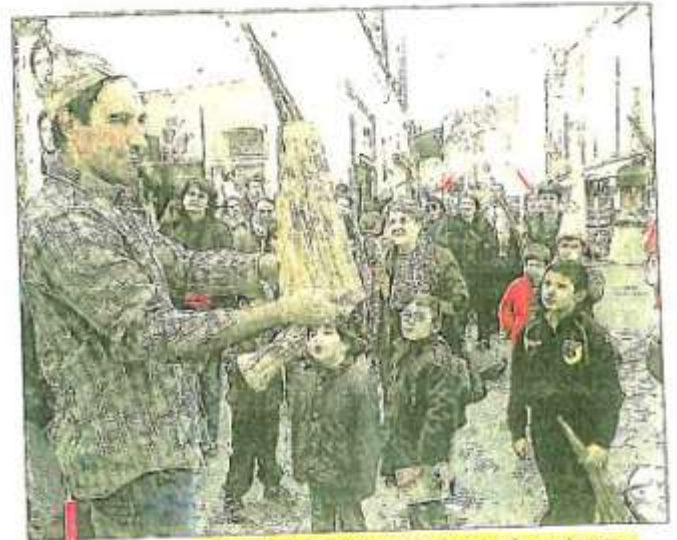
"Chapeau magique", ou comment transformer du papier en couvre-chef original.

condamnés à rester inactifs. Et puisque les familles sont l'essentiel du public de "drôles de Noël", direction la place Voltaire, choisie avec pertinence pour accueillir la patinoire, cette année. Là aussi, les parents guident leur progéniture, et ont parfois du mal à contenir leur enthousiasme, quitte à esquisser quelques pas de danse sous l'œil étonné de leurs bambins. C'est aussi sous l'œil amusé de leurs parents que les plus jeunes essaient de fabriquer des chapeaux en papier, rue de la République. Ce qui a l'air tout simple... l'est finalement, pour peu que l'on écoute les explications de l'artiste. Avec attention.