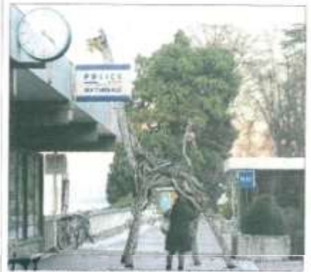
La grêle, la litière au-dessus du débarcadère, se questionne... sur ce qu'il se passe en face, sur ces gens qui arrivent en bateau depuis Lacanau. Hébert, elle regardera aussi le point d'interrogation géant éclairé, sur le lac, et qui ne devrait pas manquer d'intriguer nos voisins suisses. Le D.L.G.P.

Elles sont parfois gigantesques, parfois toutes petites. Représentations d'animaux, arches... Les sculptures en bois flotté sont plus nombreuses d'année en année, pour attirer les quelque 500 aujourd'hui, sur un rond-point, dans la rue, sur les quais, un jardin, un balcon, un ponton, il faut avoir l'œil minutieusement toutes les découvrir.