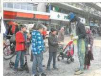
Quand on est artiste de rue, on sait parler aux enfants.

Un temps assez doux hier a permis aux familles de flâner autour des animations proposées dans le centre-ville depuis le lancement de Bonjour l'hiver vendredi soir. Les petits ont découvert la patinoire près du village de Noël d'Annemasse Tourisme, le marché de Noël a accueilli